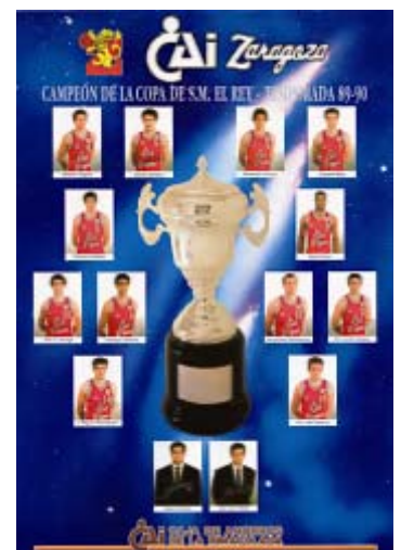
Cartel conmemorativo de la Copa del Rey de 1990 ganada por el CAI Zaragoza.