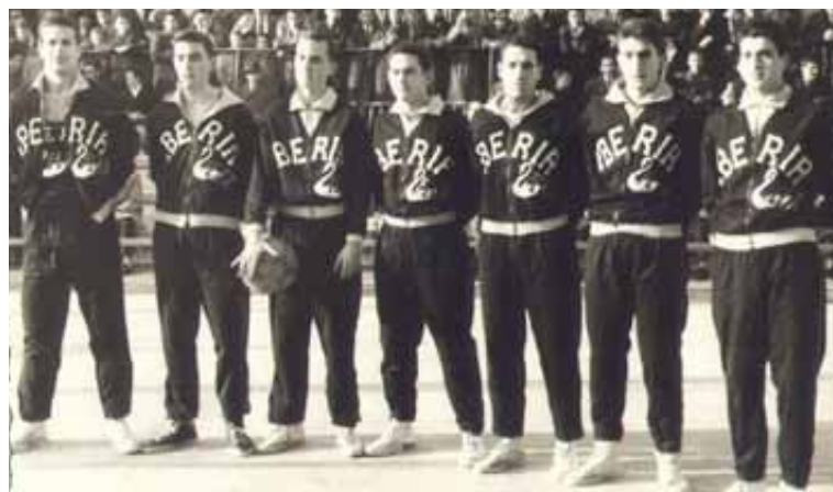
Con el Iberia (primero por la izquierda) en 1959. WWW.LACASADELBALONCESTO.ES